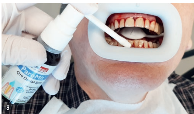
Abbildungen: © Birgit Thiele-Schelpers